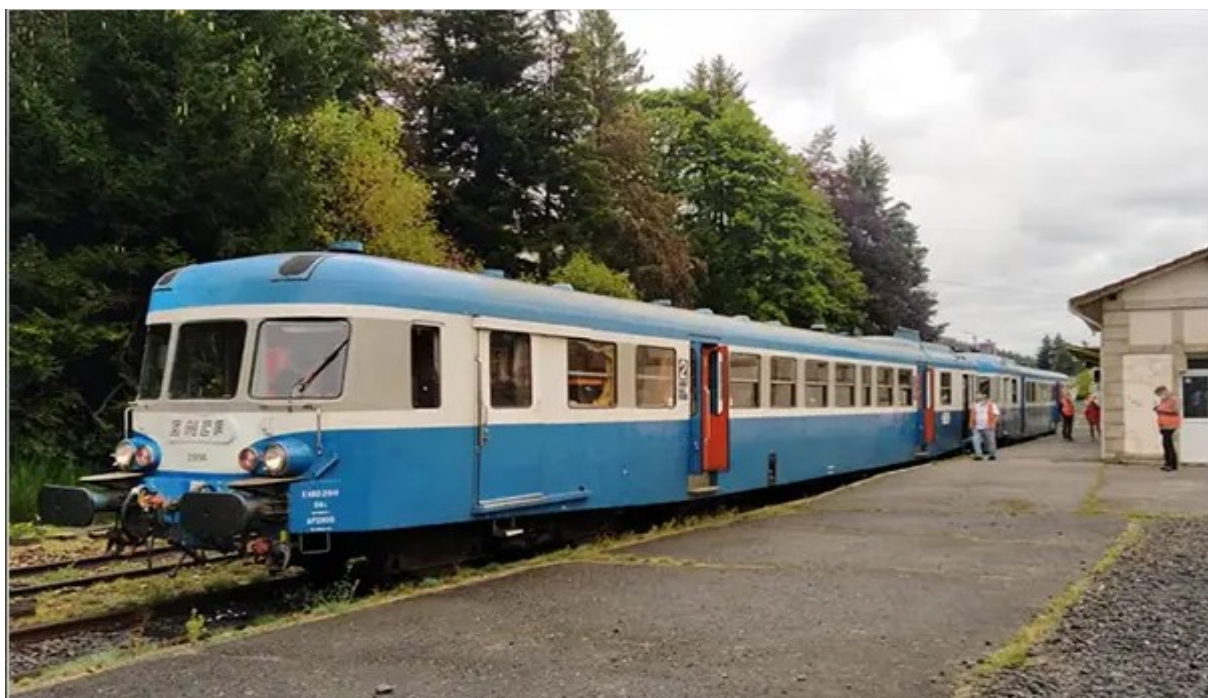
Train X2800.

Les autres photos en pièces jointes sont libres de droits : Le groupe de travail en pleine réflexion sur le projet et sur une maquette d'affiche.